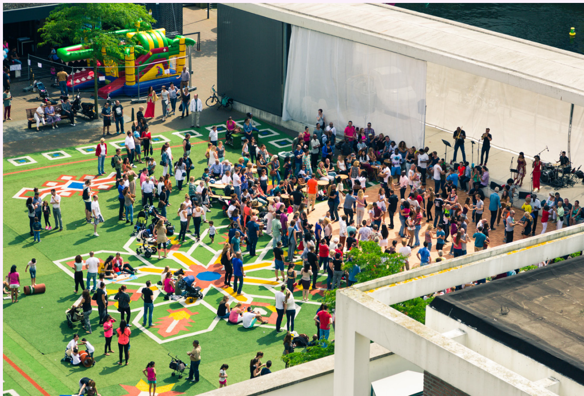
Stadspodium Rotterdam

Het is hard nodig om ook de partijen uit te nodigen die deze publieke waarden vertegenwoordigen. Geef ze een plek aan de binnenstadstafel, voer de dialoog, deel ideeën, breng een beweging op gang en werk zo samen aan een toekomstbestendige binnenstad.