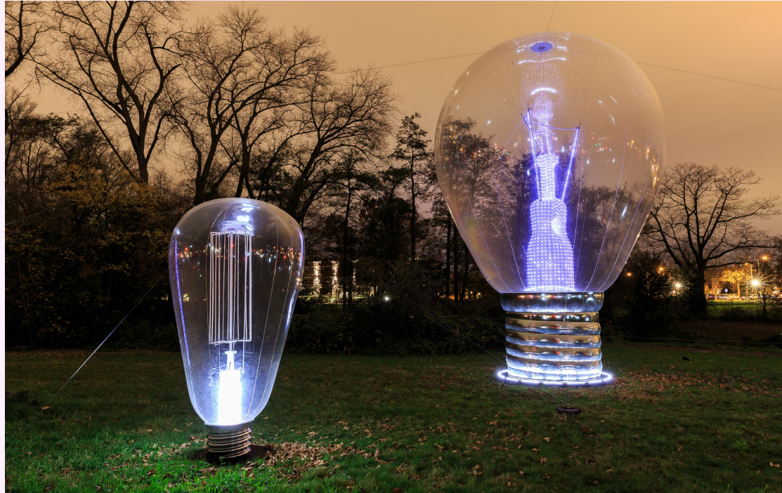
Glow Eindhoven

Investeren in je stad begint dus bij investeren in je binnenstad. Dit inzicht is nog onderbelicht in het huidige binnenstadsdebat. Verschillende clubs en initiatieven zijn wel degelijk druk met transformaties en nieuwe kansen, maar vaak versnipperd, gericht op de korte termijn en op individuele thema's. De binnenstad wordt daardoor niet in zijn volle potentie benut. Wij geloven dat gericht investeren in binnensteden zich dubbel en dwars terugverdient. Dat betekent investeren op een manier die gericht is op een gezonde, vitale en aantrekkelijke binnenstad. Dat gaat niet alleen de bezoekers, bewoners en ondernemers iets aan. Het is zaak dat een grotere vertegenwoordiging van sectoren, branches en industrieën zich bekommert over deze etalage en motor van onze samenleving. Omdat ze er een (gedeeld) belang in hebben. Want je bent zo sterk als je eigen binnenstad.